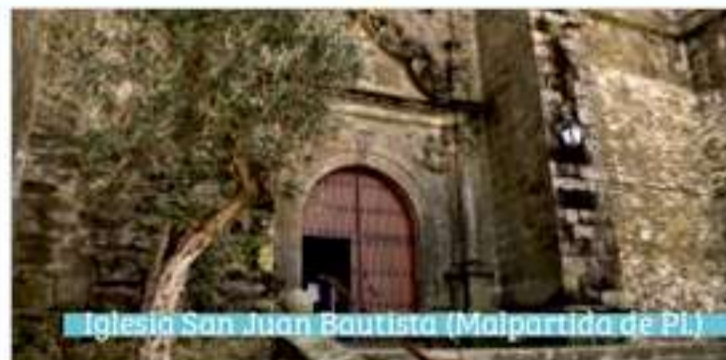
Iglesia San Juan Bautista (Malpartida de Pl.)

Iglesia de San Juan Bautista (Saucedilla) Declarada Bien de Interés Cultural desde 1993. Del siglo XVI y de estilo renacentista, destaca por sus dimensiones, el retablo mayor barroco, varias tallas policromadas y el púlpito.