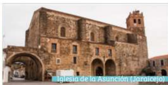
Iglesia de la Asunción (Jaraicejo)

8 Bienes de Interés Cultural con categoría de Monumento