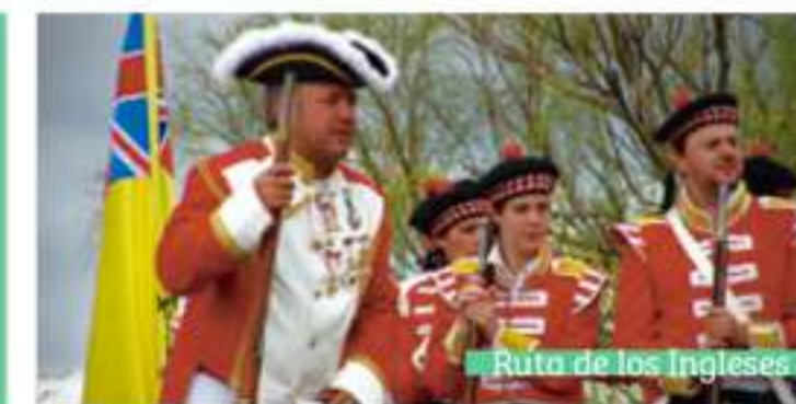
Ruta de los Ingleses

Iglesia de San Juan Bautista (Saucedilla) Declarada Bien de Interés Cultural desde 1993. Del siglo XVI y de estilo renacentista, destaca por sus dimensiones, el retablo mayor barroco, varias tallas policromadas y el púlpito.